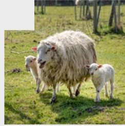
Weißer Hornloser Heidschnucke 240,00 € / Jahr