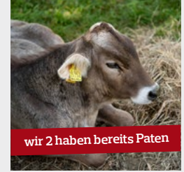
Original Braunvieh 500,00 € / Jahr

Die Patenschaft dauert ein Jahr und endet automatisch. Der Betrag deckt einen Teil der Kosten für Pflege, Futter, Instandhaltung des Geheges, Personaleinsatz sowie Zuchtanschaffung und medizinisch vorgeschriebene Untersuchungen.